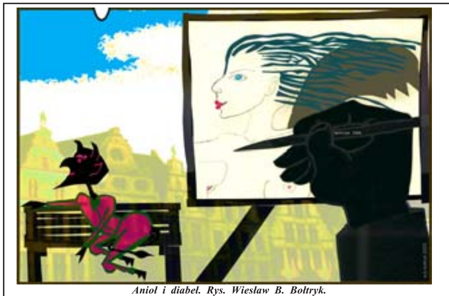
Anioł i diabeł. Rys. Wiesław B. Boltryk.

Zawarto akty notarialne z najemcami mieszkań położonych w budynkach przy ul. Składowej 5b, Gołdapskiej 16, Partyzantów 3, Batorego 19, plac Wolności 9 oraz Wojska Polskiego 15. Sprzedano również lokal użytkowy w budynku Kościuszki 10.