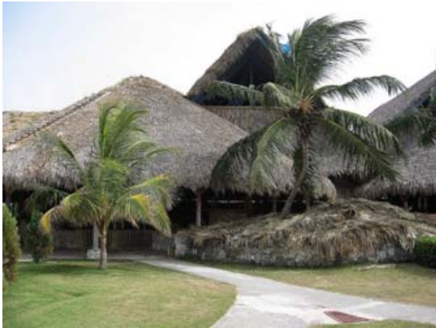
Punta Cana. Port lotniczy

trzymaliśmy autobus. Kierowca powiedział, że jedzie na lotnisko w Punta Cana (20 peso). Guzik prawda! Zrobiliśmy wielkie koło i przyjechaliśmy do Bavaro, praktycznie do miejsca, z którego wyjechaliśmy. Albo nas do końca nie zrozumiał,