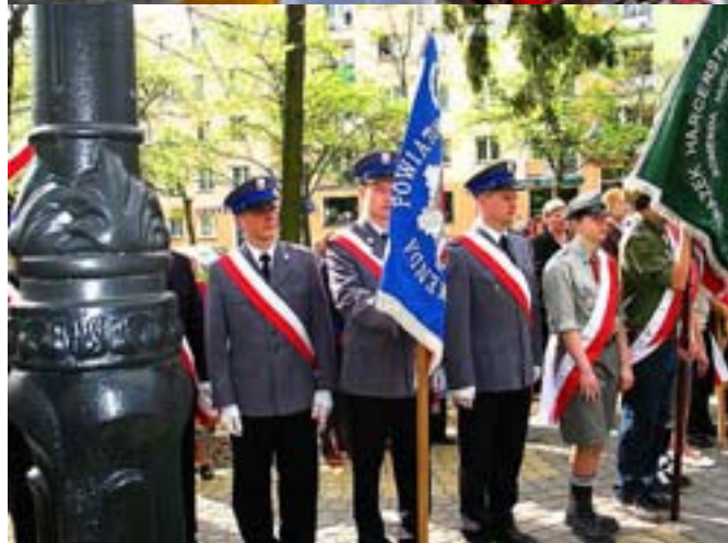
Fot. Bolesław Słomkowski