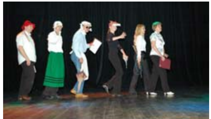
Znane oleckie osobistości wcieliły się w postacie z Czerwonego Kapturka.