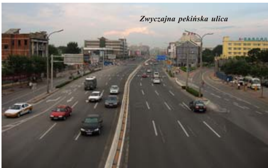
Zwyczajna pekińska ulica

mózgów i płodów. Są też obcięte głowy oraz ciała kobiety i mężczyzny obdarte ze skóry. Wargi i paznokcie są nietknięte. Nie przeszkadzał mi taki widok. Z jeszcze większym zainteresowaniem oglądałem anatomiczne szczegóły człowieka. Nie odczuwałem żadnego obrzydzenia.