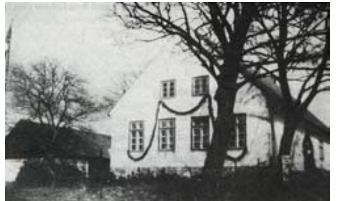
Szkoła w Zawadach - 1938