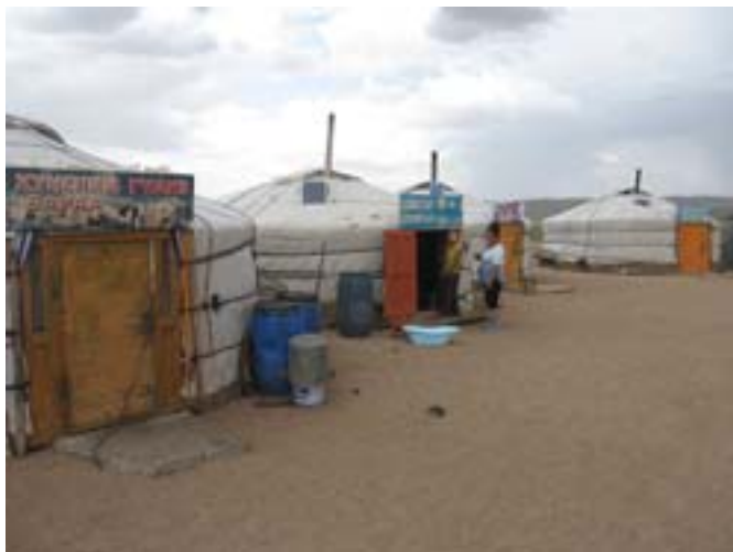
Jurty w zajeździe

Z Ułan Bator wyjechaliśmy o godz. 8.30. Tuż za stolicą przy lotnisku (malutkie, skromniutkie, jeden pas startowy) zatankowaliśmy 73 litry za 54 tys. tugrików. Tutaj kierowca jednego z samochodów zobaczył, że jesteśmy biali i zagaił... po rosyjsku, ale powiedział tylko jedno słowo w formie pytania: charaszo?