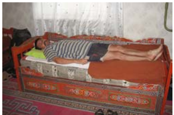
Leżę na mongolskim łóżku