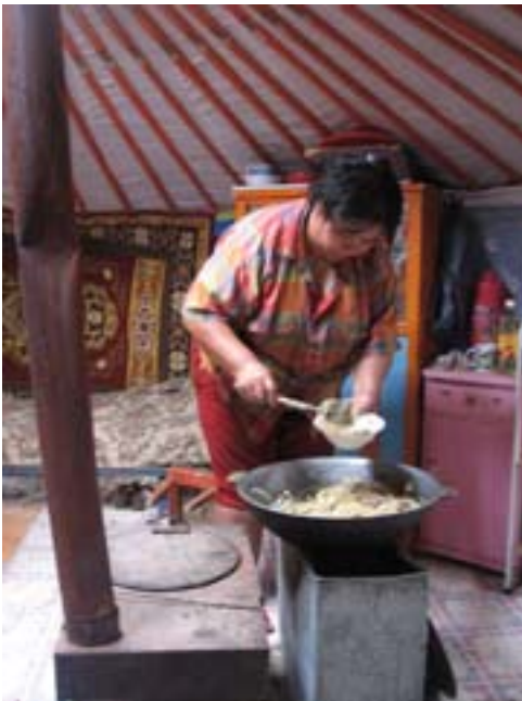
Mongolka przygotowuje posiłek

najdawniejszych czasów najliczniej hodowali owce – to one żywiły i o d z i e w a ły Mongołów, przerobiona na wójłok wełna służyła za pokrycie jurt, wozów oraz za koce. Hodowcy, oprócz biznesmenów, to najbogatsi ludzie w Mongolii.