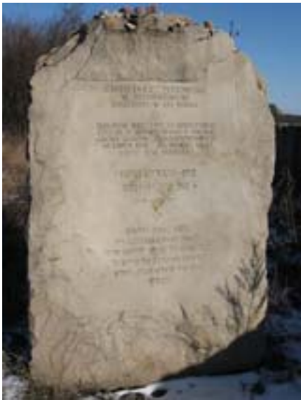
Frontowa ściana pomnika.