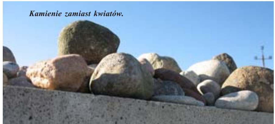
Kamienie zamiast kwiatów.

Po przeciwległej stronie modlitwa za zmarłych w języku hebrajskim: „ El male rahamim! Boże pełen miłosierdzia daj słuszny odpoczynek na skrzydłach Twojej obecności duszom zamordowanych w Jedwabnem, które poszły do swojego świata. Niech znajdą odpoczynek w ogrodzie Edenu ”.