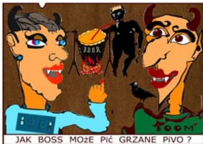
Rys. Wiesław B. Boltryk

Podpis elektroniczny, certyfikat kwalifikowany AUTORYZOWANY PARTNER UNIZETO TECHNOLOGIES S.A. PUNKT POTWIERDZANIA TOŻSAMOŚCI Skrzynka podawcza, e-faktura, certyfikaty niekwalifikowane, ssl, zabezpieczenia serwerów, system unilock. Oprogramowanie, sprzęt, integracja z Płatnikiem, wdrożenia, wszystko w siedzibie klienta. MTL Creation, tel. 600 936 589, www.mtl.olecko.pl