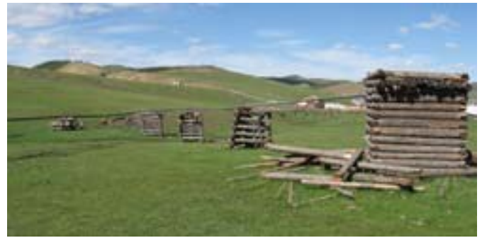
Tak dostarczana jest woda ze źródła .

Jeżeli do tego dołożę jeszcze trochę przysłów mongolskich,