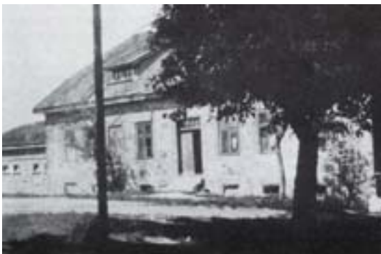
Majątek Siejnik - budynek inspektoratu

W 1908 roku zarządzenie dworem przejął mój mąż. Działal-