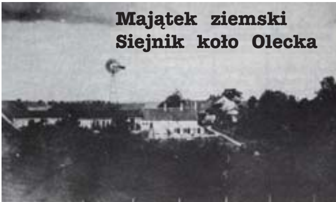
Majątek ziemski Siejnik koło Olecka

Autorstwa Friedy Fähser, z domu Papendieck