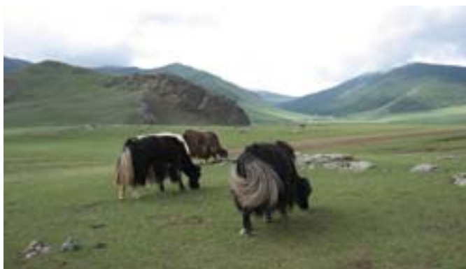
Pasące się jaki.

Poszedłem nad wodospad i umyłem twarz w zimnej wodzie. Później przyglądałem się jakom, które pasły się nieopodal jurt. Po kilku godzinach zrobiło się ciepło, było słonecznie.