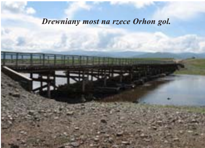
Drewniany most na rzece Orhon gol.