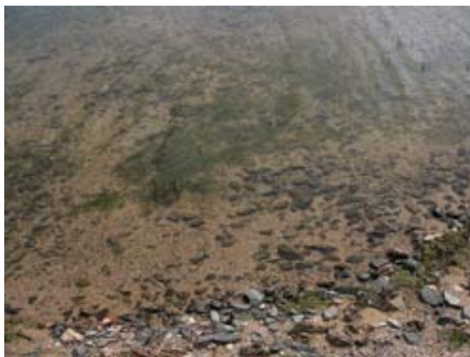
Czysty brzeg jeziora.

Podziwiałem niebieskie osty na wzgórzach i stroje Mongołów. Nieważne gdzie przebywa w danej chwili Mongoł, ważne, że nie rozstaje się ze swoim deelem, długą tuniką ze stójką, w której przednie poły zachodzą głęboko jedna na drugą, w pasie przepasuje się ją jedwabnym pasem bus w kontrastowym kolorze o długości nawet do 6-7 m. Czasami na wierzch deele zakłada się bogato haftowany bezrękawnik. Ciepłe deele noszone zimą szyte są na futrze. Ten rodzaj ubrania jest bardzo praktyczny. Noszą go kobiety, mężczyźni i dzieci. Górna części deeli do pasa, tzw. pazucha, służy mężczyznom niczym kieszeń do noszenia tytoniu, tabakierki oraz innych osobistych drobiazgów, z której nic nie wypada nawet przy szybkiej jeździe na koniu.