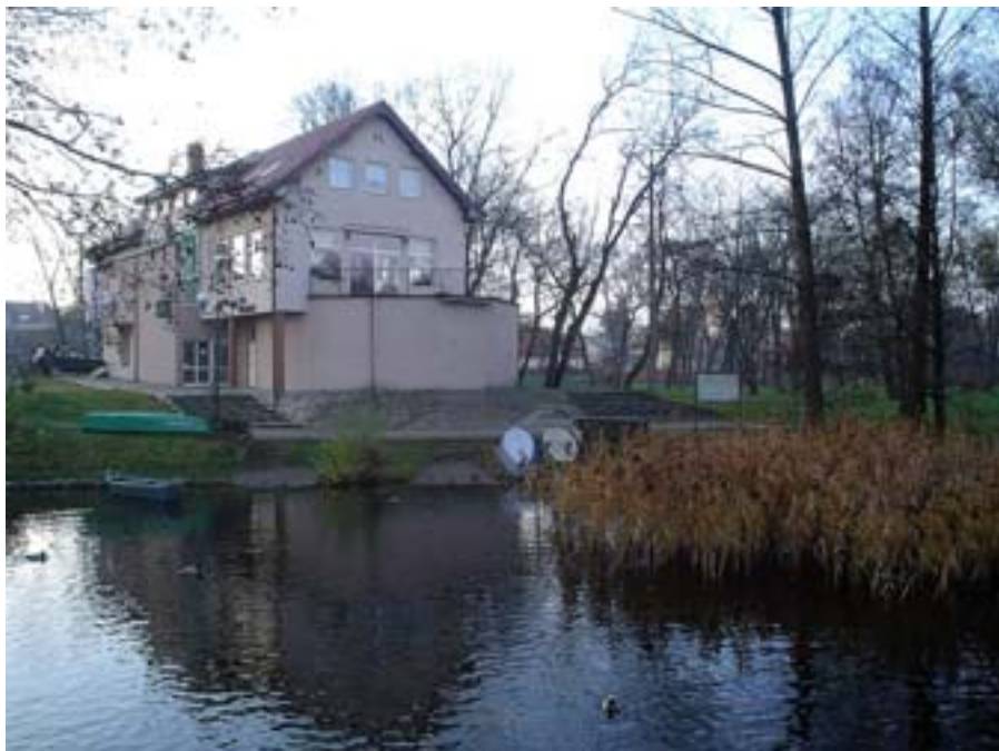
Fot. Restauracja „Elipsa”. W tym miejscu stała przedtem opisywana w tekście altanka. W latach 60-80. XX wieku była to również stacja wodna („Domek Baby Jagi”).