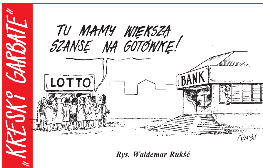
Rys. Waldemar Rukść

Ale zobaczymy co wydarzy się w tym tygodniu. Do poczytania za tydzień.