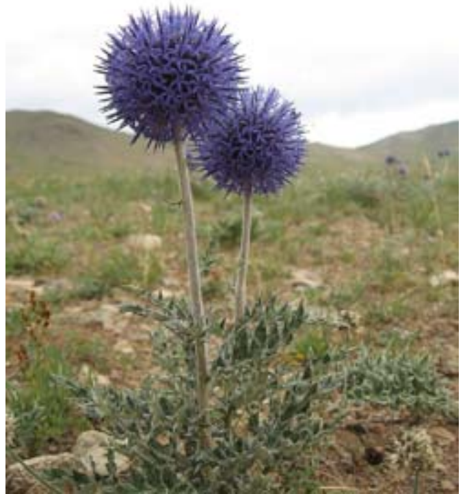
Fioletowe osty na wzgórzach.

Wieczorem zdobyłem trzy najbliższe szczyty. O godz. 21.30 w jurcie pojawiło się jako takie światło z generatora. Rozpaliliśmy w piecu. Zrobiło się ciepło. Najgorzej będzie z tymi szczurami, bo kot nie upolował ani jednego.