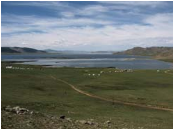
Jezioro Terhiyn Tsagaan nur.

Bardzo duże różnice temperatury powietrza pomiędzy dniem a nocą, sprawiają, że na pustyni lite skały kruszą się. Pękają