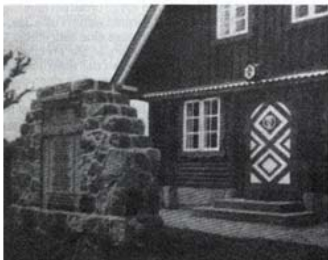
Pomnik przed domem Jahna ku czci poległych w I wojnie światowej gimnastyków z ZGO 1865