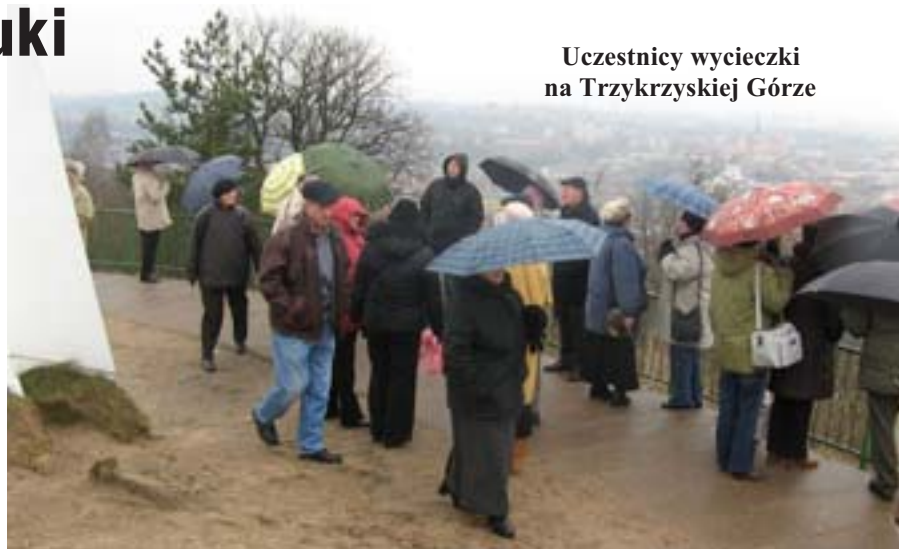
Uczestnicy wycieczki na Trzykrzyskiej Górze

chodów ulicach rozłożyło się mnóstwo straganów, gdzie chyba każdy znalazł jakąś pamiątkę, którą zakupił i przywiózł do Olecka.