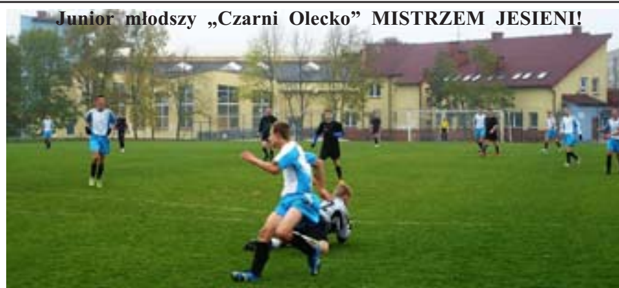
Junior młodszy „Czarni Olecko” MISTRZEM JESIENI!