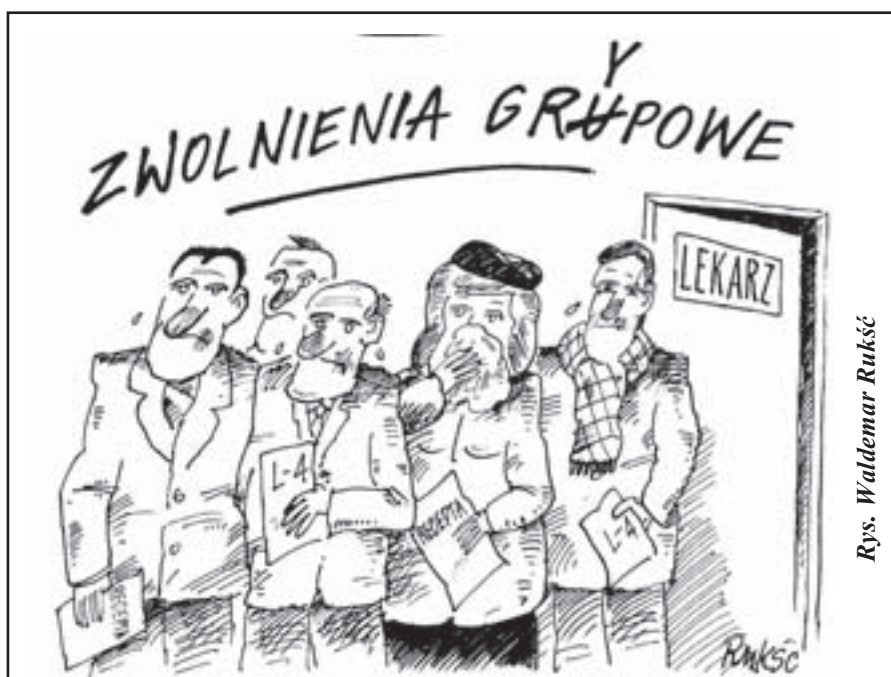
Rys. Waldemar Rukść