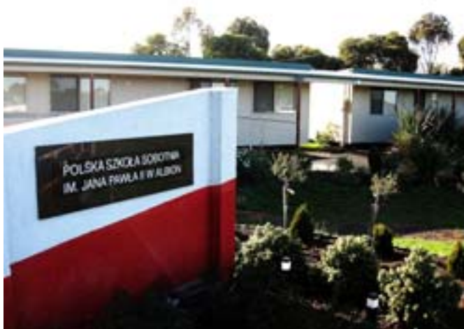
Polska szkoła w Albion.

Wstałem o godz. 8.00. Kazia zrobiła śniadanie i odwiozła mnie do Albion. Tam spotkałem się z naszą grupą i pojechaliśmy na południe od Melbourne. W Albion, dzielnicy Melbourne, na terenie Polskiego Ośrodka Sportowo-Rekreacyjnego funkcjonuje Polska Szkoła Podstawowa i Średnia im. Jana Pawła II. Jest to największa placówka oświatowa na terenie Australii. Szkoła podstawowa to klasy I-VI, a średnia VII-X. Zajęcia odbywają się w soboty.