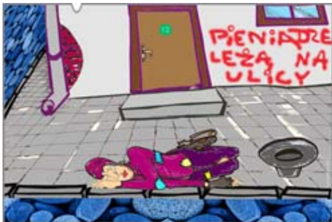
Pieniądze leżą na ulicy. Rys. Wiesław B. Boltryk