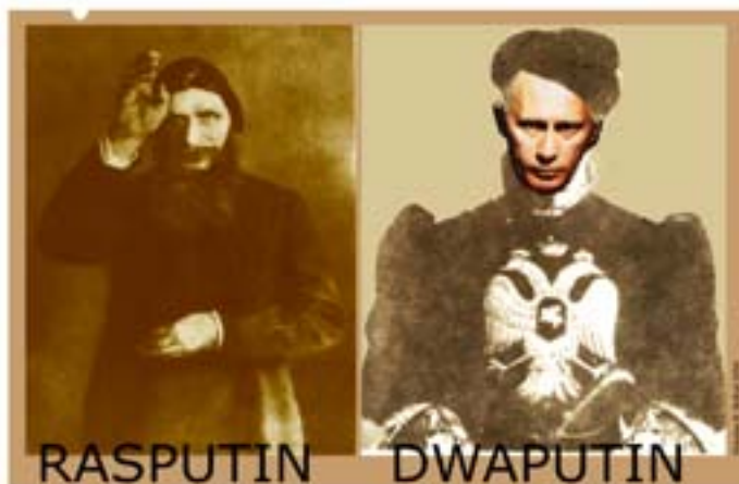
Rys. Wiesław B. Boltryk