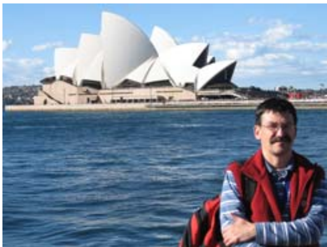
Na tle opery.

Uczestniczyłem we mszy na Barangaroo, w tym samym sektorze co wczoraj. Dzisiaj była też droga krzyżowa w postaci widowiska teatralnego. W różnych częściach Sydney rozmieszczono kolejne stacje. Żeby tam być, trzeba okazać karty wstępu. Mam otarte palce lewej stopy. Chodzę w nowych butach, stąd taka sytuacja. Boli niesamowicie. Ale nie przeszkodziło mi to w wyprawie na słynny most Harbour. Rozciąga się z niego wspaniały widok na miasto, a szczególnie na gmach opery. Jest specjalna kładka dla przechodniów. Niestety, jest tak głośno, że nawet własnych myśli nie słyszę. Po moście każdego dnia przejeżdża ponad 160 tysięcy samochodów. Dla nich przeznaczono osiem pasów. Są też 2 tor kolejowe i pas rowerowy. Wszystko to na szerokości 50 metrów.