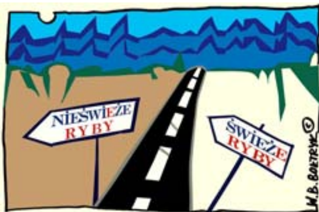
Rys. Wiesław B. Boltryk.

PUNKT INFORMACJI KRS - WYPISY AKTUALNE I PEŁNE MTL Creation, tel. 600 936 589, www.mtl.olecko.pl