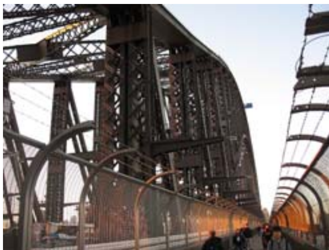
Most Harbour nad zatoką Port Jackson

mi się Melbourne. Zresztą te dwa miasta rywalizują ze sobą w tym względzie. Chodzi im też o wieżowce. W Melbourne jest ich więcej (26). Nowo powstające drapacze chmur mają