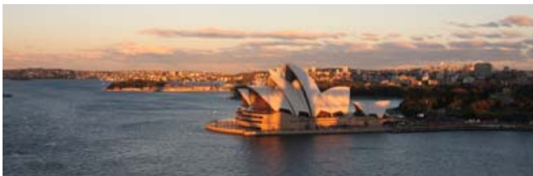
Widok z Harbour Bridge na operę.

Harbour Bridge to jeden z najwyższych i najdłuższych jednoprzęsłowych mostów na świecie, rozciągnięty nad zatoką Port Jackson. Łączy część północną i południową Sydney. Jego jedyne przęsło jest zawieszane na wysokości 52 metrów nad wodą, dzięki czemu nawet największe statki oceaniczne mogą swobodnie pod nim przepłynąć. Został oddany do użytkowania w 1932 roku (budowę rozpoczęto w 1923r.), a ze względu na formę nazywany jest „Wielkim Wieszakiem” czy też „Żelaznym Płucem”. Można też wejść na szczyt łuku. Most oparty jest na 12-metrowych fundamentach z betonu i granitu. Ma 1149 metrów długości. Jego najwyższy