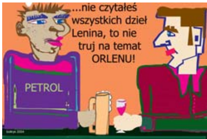
Rys. Wiesław B. Boltryk.