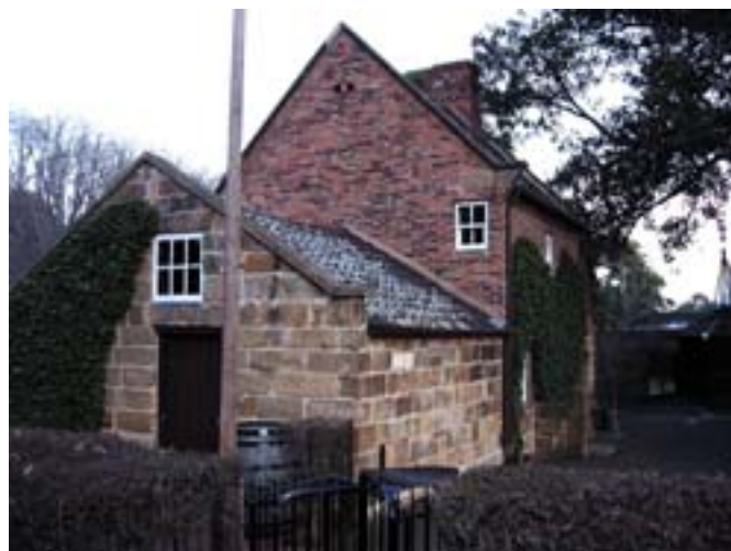
Dom kapitana Cooka.

lerach. Australia okazała się więc odpowiednim miejscem na kolonię karną. W 1787 roku do Australii wyruszyła pierwsza flota z 759. skazańcami (568 więźniów, 191 więźniarek) oraz 211 marynarzami wraz z rodzinami słoczonymi na pokładzie 11 statków, dowodzona przez kapitana Arthura Phillipa. 26 stycznia 1788 r. statki dobiły do australijskiego brzegu. Z okrętów zeszedli na ląd nowi mieszkańcy tej ziemi. Przestępcy (w tym koniokradcy) i więźniowie polityczni po odświeżeniu kary zakładali tutaj domy. Tak założyli miasto Sydney. Nowym mieszkańcom dokuczał klimat i głód. Aborygeni traktowali ich wrogo, a przeznaczone do zasiewu ziarno uciepiał w czasie podróży i nie wykiełkowało na jałowej glebie. Przywiezione bydło zdziczało, owce padły ofiarą skazańców, Aborygenów i psów dingo.