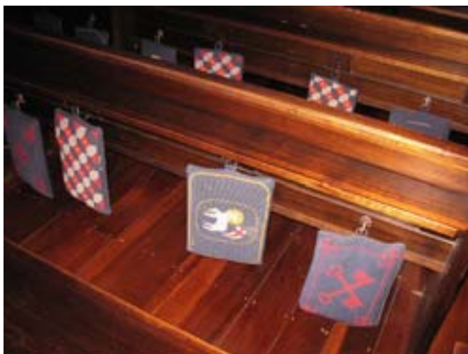
Poduszeczki do siedzenia w kościele.

Zachodziliśmy do kościołów różnych wyznań i do sklepów. Widzieliśmy też słynny dom kapitana Cooka, jednego z odkrywców Australii. Dom rodzinny Cooka jest ewenementem na skalę australijską, bo jest starszy (w odkrywczym słowa tego znaczeniu) niż cała Australia. Pochodzi z 1755 r. Zakupiono go w Anglii i przewieziono w częściach do Melbourne, gdzie w 1934 r. postawiono na nowo w Fitzroy Gardens (z okazji 100-lecia miasta). James Cook urodził się w ubogiej rodzinie. Był synem szkockiego imigranta, który najmował się do pracy w polu. Podczas terminowania na statku handlowym odkrył pasję swego życia.