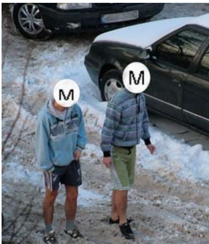
Niedawno przez Olecko przejeżdżała grupa z MO – MrozoOdporni. Mróz -14C nie zrobił na nich żadnego wrażenia. Oto fakty.