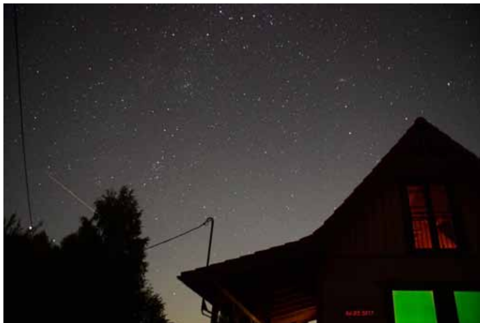
Czekając na perseidy